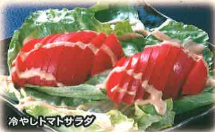
冷やレトマトサラダ