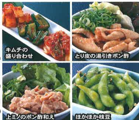
キムチの盛り合わせ