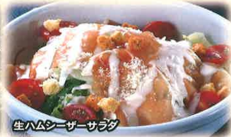
生ハムシーザーサラダ