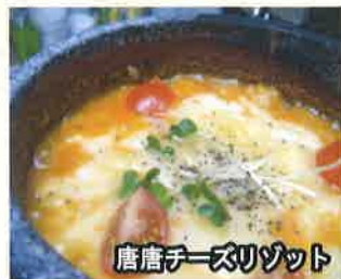
唐唐チーズリゾット