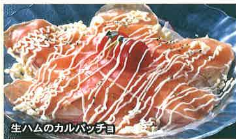
生ハムのカルパッチョ

冷やレトマトサラダ ..... 550円 産地直送こだわリトマト!! (税込 605円)