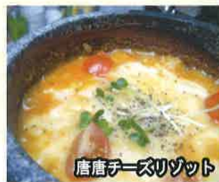
唐唐チーズリゾット