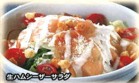
生ハムシーザーサラダ