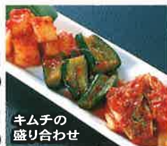
キムチの盛り合わせ