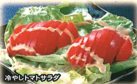
冷やレトマトサラダ