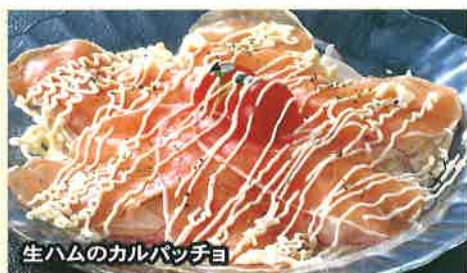
生ハムのカルパッチョ

冷やレトマトサラダ ..... 450円 (税込 495円) 産地直送こだわリトマト!!