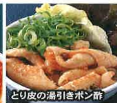
とり皮の湯引きポン酢