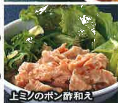
上ミノのポン酢和え